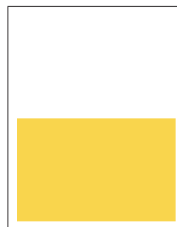
1/2 page 10,5 x 6,75 + 0,25 de marge perdue